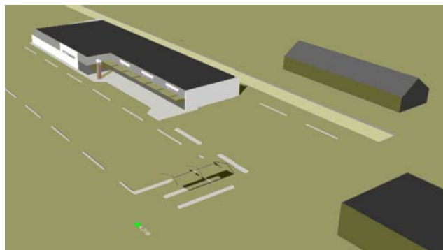
Skýrtingarmynd: Fyrirhuguð bygging og nánasta umhverfi