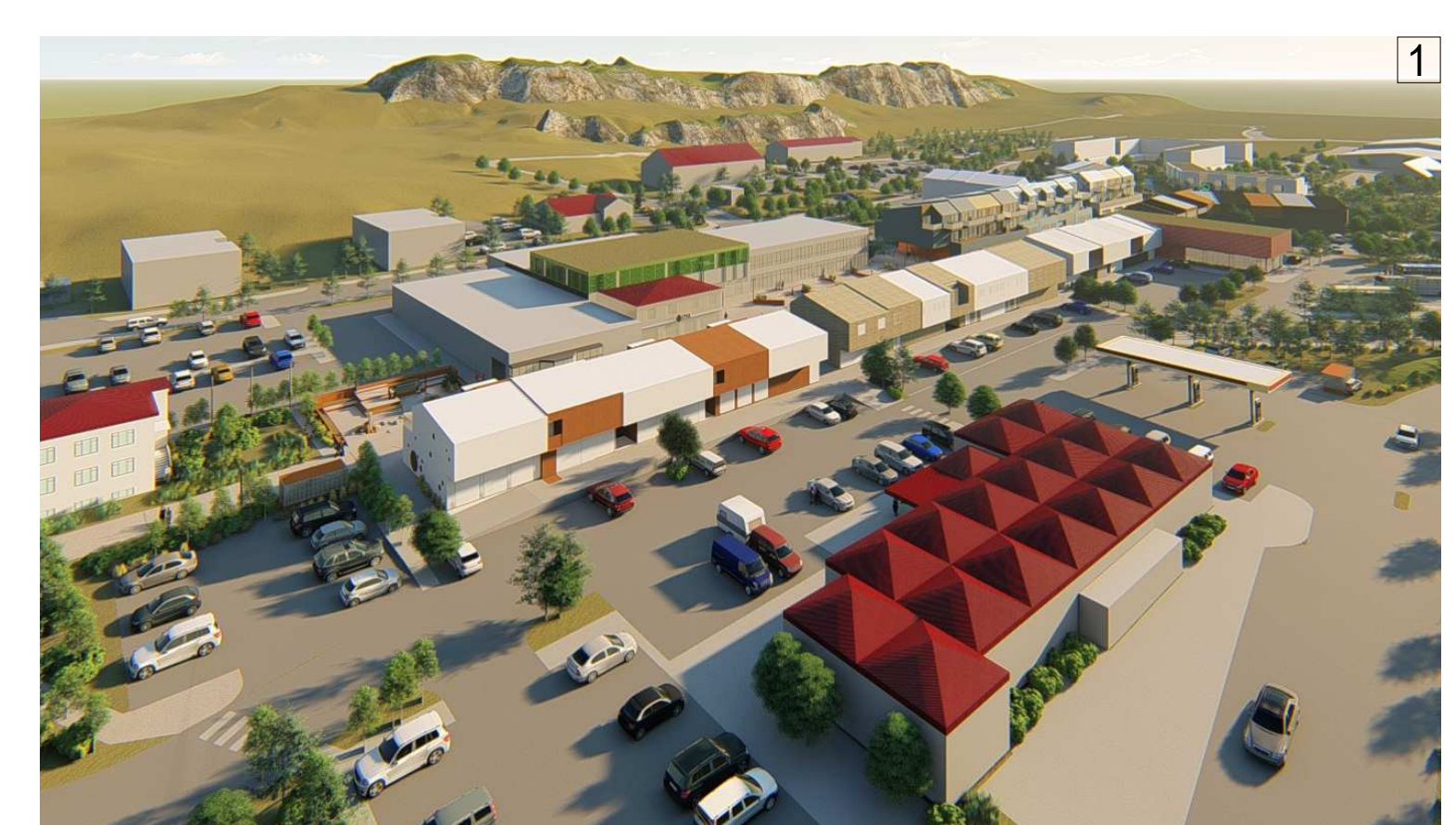
Yfirbragð byggðar horft í átt að Hömrum