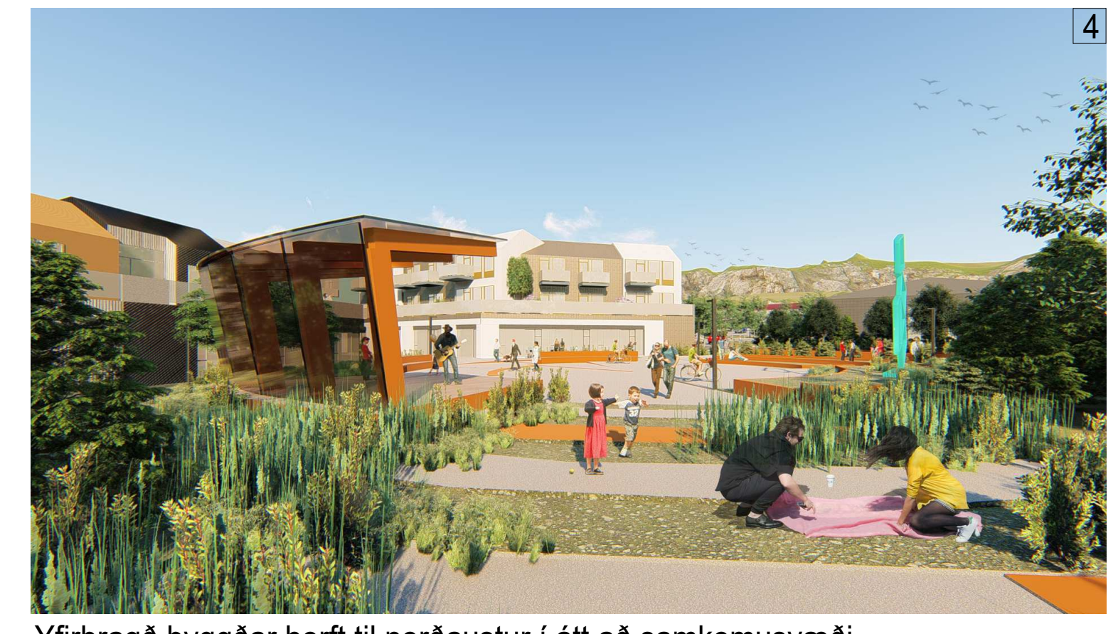
Yfirbragð byggðar horft til norðaustur í átt að samkomusvæði