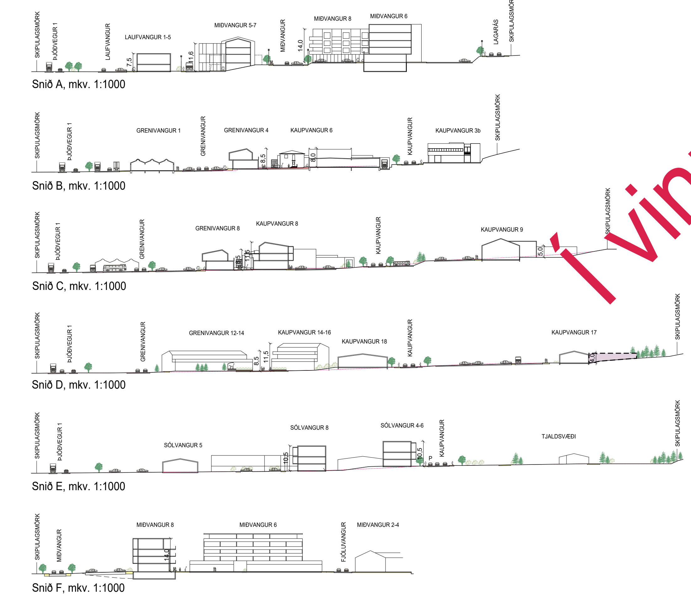
Snío F, mkv. 1:1000