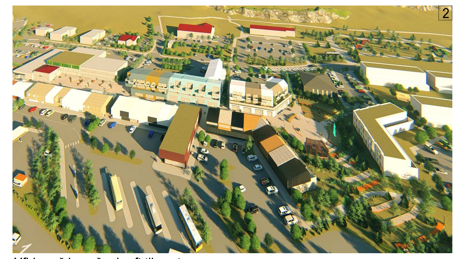
Yfirbragð byggðar horft til austurs