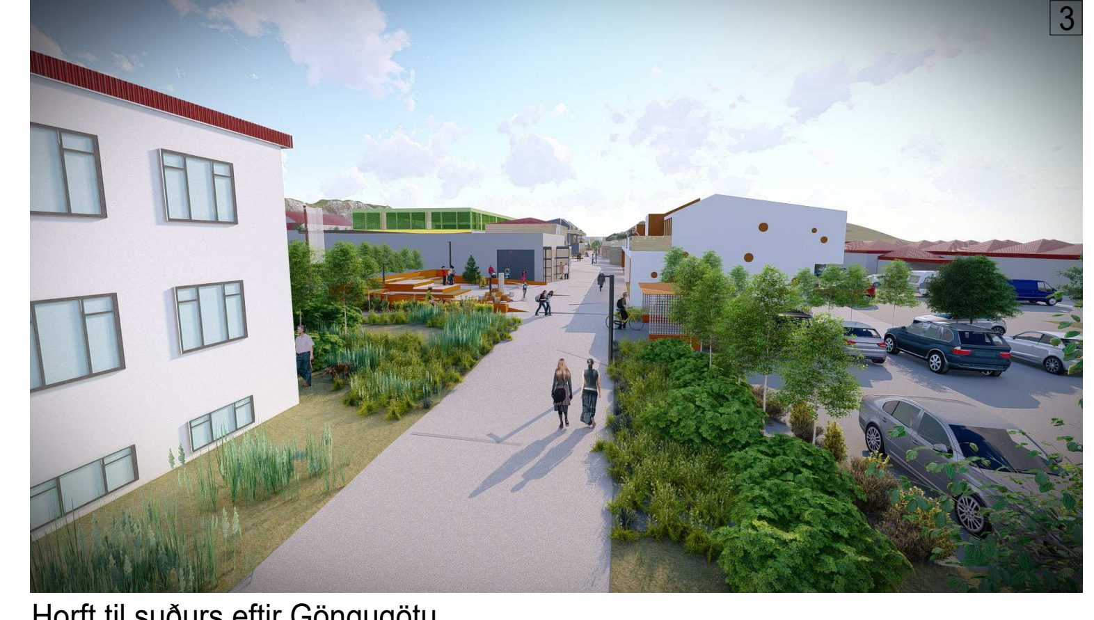
Horft til suðurs eftir Göngugötu