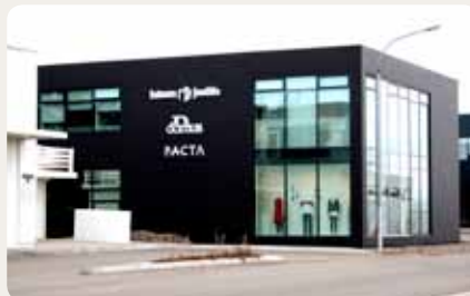
Verslanir og þjónusta Kaupvangi 3, Egilsstöðum