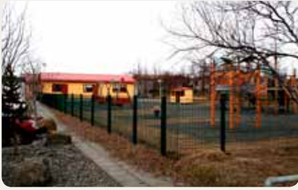
Leikskólinn Hádegishöfði, Fellabæ