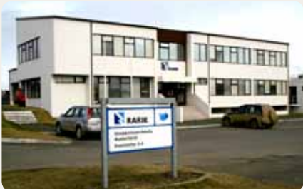
Höfuðstöðvar RARIK, Austurlandi