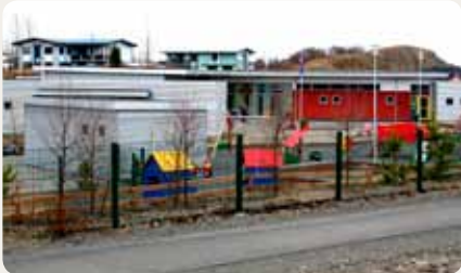
Leikskólinn Tjarnarskógur, Skógarlöndum, Egilsstöðum