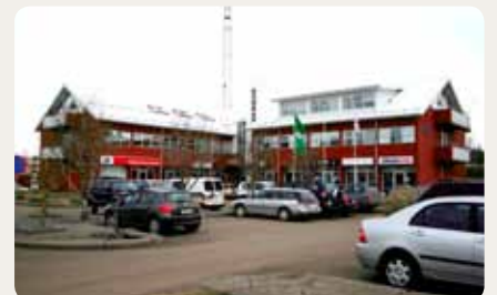
Verslana- og þjónustukjarninn Miðvangi 2-4, Egilsstöðum