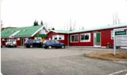
Leikskólinn Tjarnarskógur, Tjarnarlöndum, Egilsstöðum