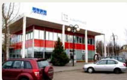
KPMG og Arionbanki, Egilsstöðum