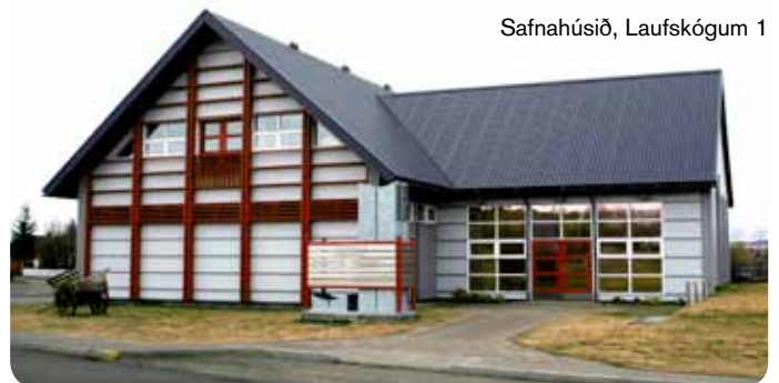
Safnahúsið, Laufskógum 1

Sláturhúsið, menningarsetur er starfrækt á Egilsstöðum. Þar fer fram öflugt menningarstarf. Þar eru vinnustofur listamanna úr héraði og sýningarsalir. Hægt er að bóka aðstöðu fyrir sýningar og fundi í Sláturhúsinu. Sími Sláturhússtjóra er 894 7282.