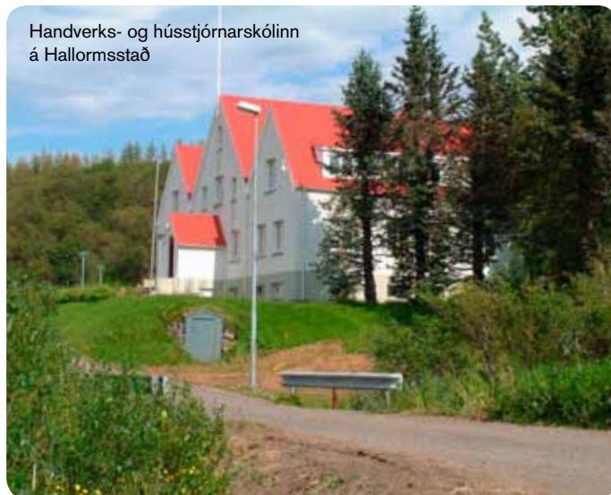
Handverks- og hússtjórnarskólinn á Hallormsstað