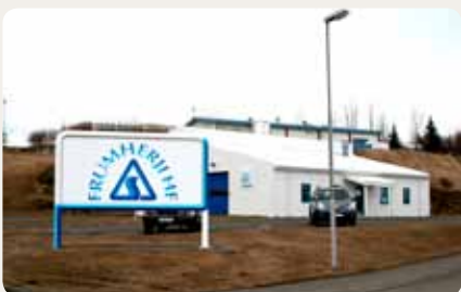
Frumherji, bifreiðaskoðun, Fellabæ