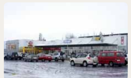
Verslanakjarninn við Egilsstaðanesið