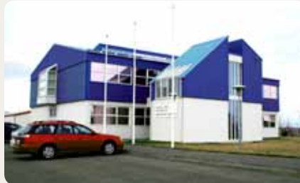
Skrifstofur lögreglu- og sýslumannsembættis