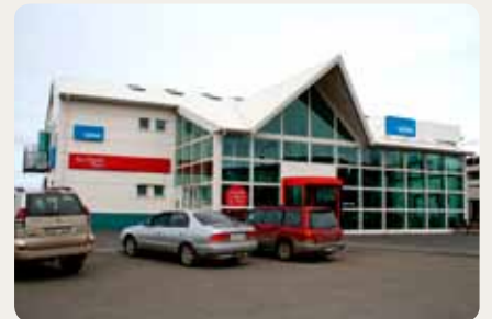
Verslana- og þjónustukjarninn Nían, Miðvangi 1-3, Egilsstöðum