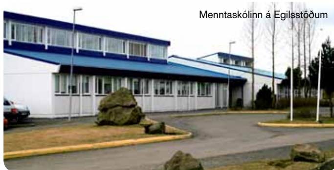
Menntaskólinn á Egilsstöðum

Pekkingarnet Austurlands miðlar háskólanámi frá háskólum landsins og þjónustar fjarnema með ýmsum hætti. Það skipuleggur einnig námskeið á fjölmörgum sviðum og veitir ráðgjöf til fyrirtækja og einstaklinga. Pekkingarnetið rekur Háskólanámssetur á Egilsstöðum auk þess sem það tekur þátt í rekstri námsvera á nokkrum stöðum á Austurlandi í samstarfi við framhaldsskóla og sveitarfélög.