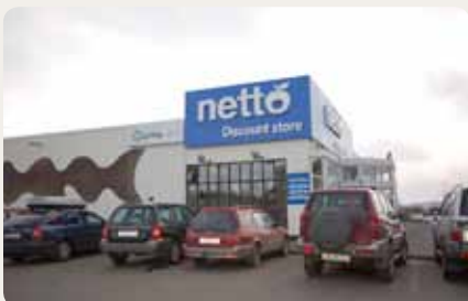
Nettó og Lyfja, Kaupvangi