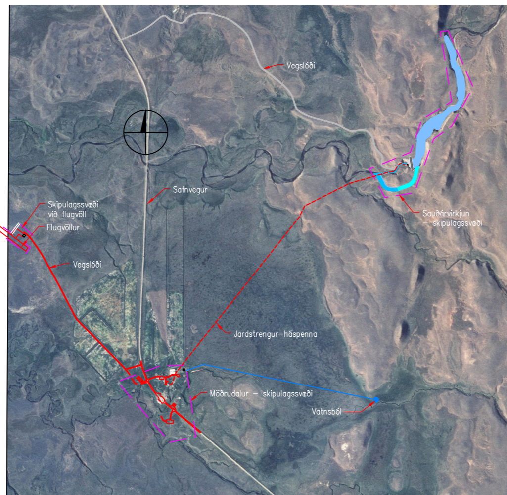
YFIRLIT SKIPULAGSSVÆÐIS 1:15000