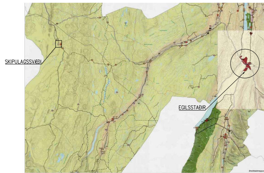
ÓR SVEITARFÉLAGSUPPRÆTTI AÐALSKIPULAGS FLJÓTSDALHÉRAÐS 2008-2028