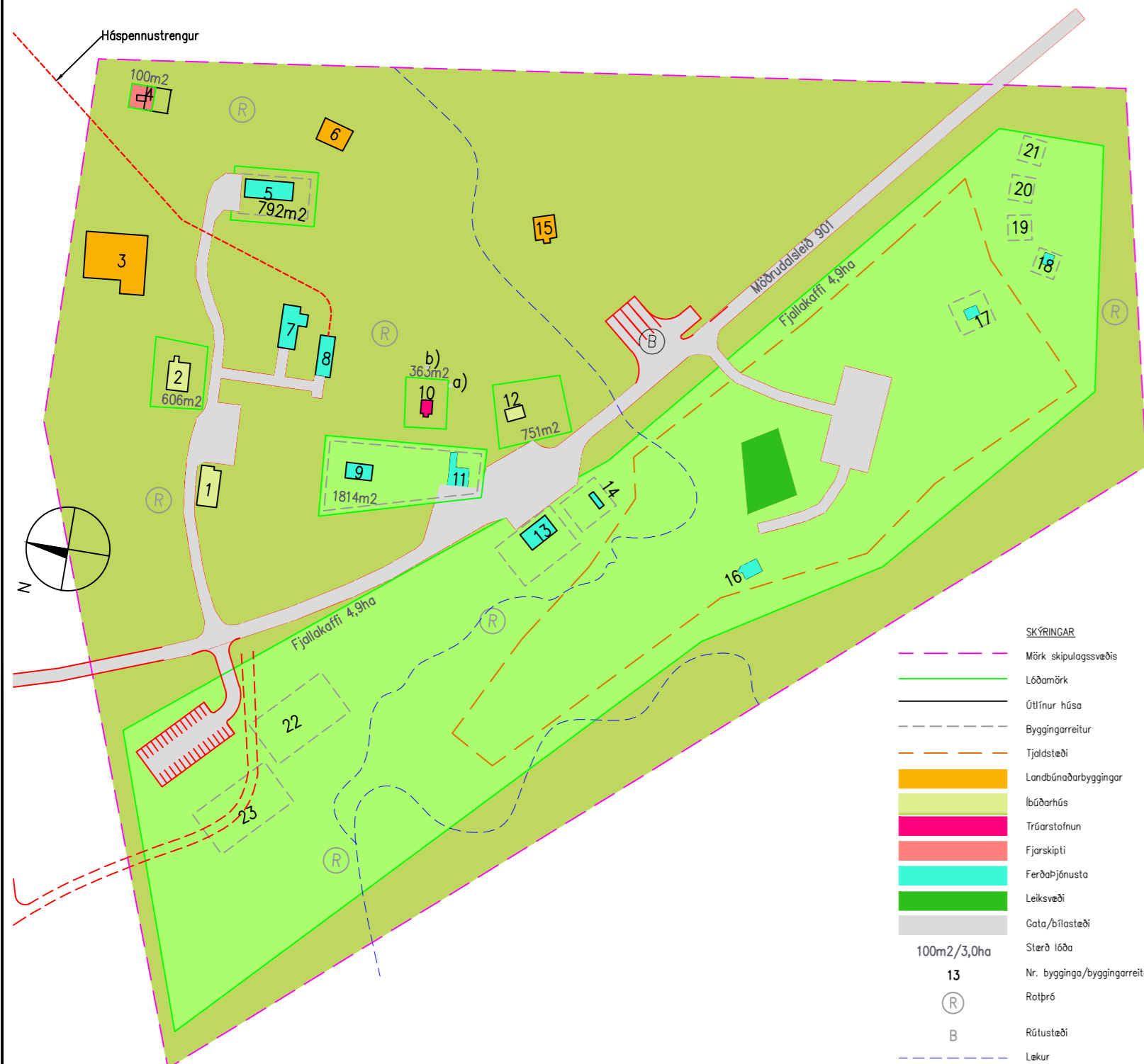
MÖÐRUDALUR BÆJARSTÆÐI 1:1500